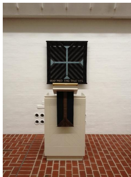
Prædikestolen i Gjesing kirke

prædikestolen ofte en læsepult, der står direkte på gulvet.