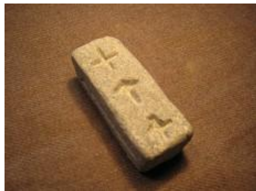
Rekonstruktion af støbeform fra Vikingelandsbyen, Albertslund

Sølvsmedens støbeform er et fund fra vikingetiden. Den har form til at støbe både et kors og en Thorshammer.