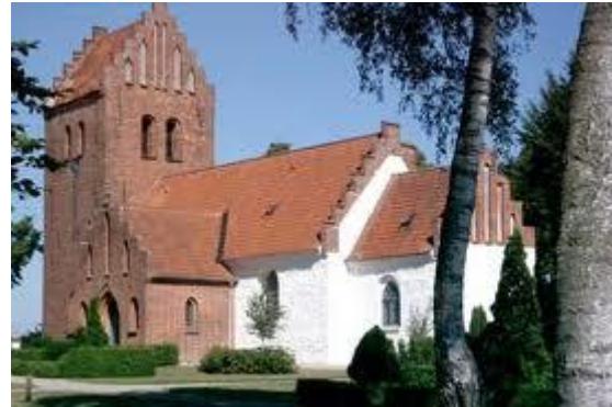
Osted kirke ved Roskilde, en romansk kirke med gotiske tilbygninger

gik ind i kirken. Fra våbenhuset begyndte man også processioner ind i kirken, og våbenhuset kunne i katolsk tid også bruges til at holde skrifte, dvs. bekende sine synder for præsten.